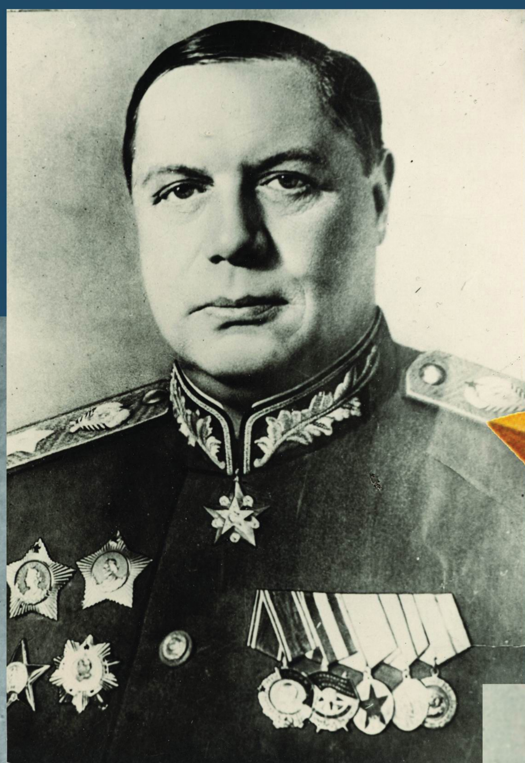
Толбухин Фёдор Иванович

Герой Советского Союза, Герой Народной республики Болгария, Маршал Советского Союза. Успешно действовал в Сталинградской битве, Ростовской, Донбасской, Мелитопольской, Одесской, Ясено-Кишиневской, Белградской, Будапештской, Балатонской и Венской операциях. 26 апреля 1945 года за руководство боевыми операциями большого масштаба в деле разгрома немецко-фашистских войск награжден орденом Победы, 2-мя орденами Ленина, 3-мя орденами Красного Знамени, 2-мя орденами Суворова I степени, Кутузова I степени, Красной Звезды, 10 иностранными орденами. 7 мая 1965г. В честь Маршала названы улицы в городах Москве, Кишиневе, Ярославле, Софии, Будапеште, Белграде.