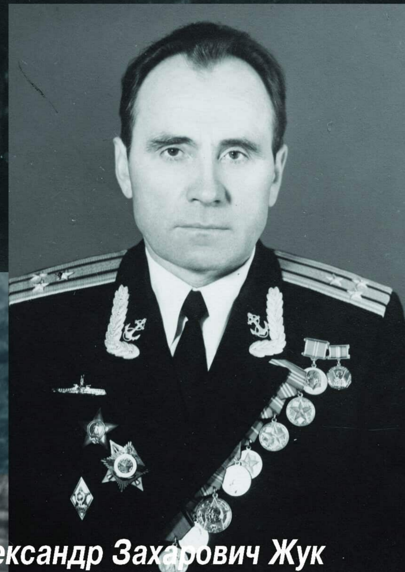
Александр Захарович Жук