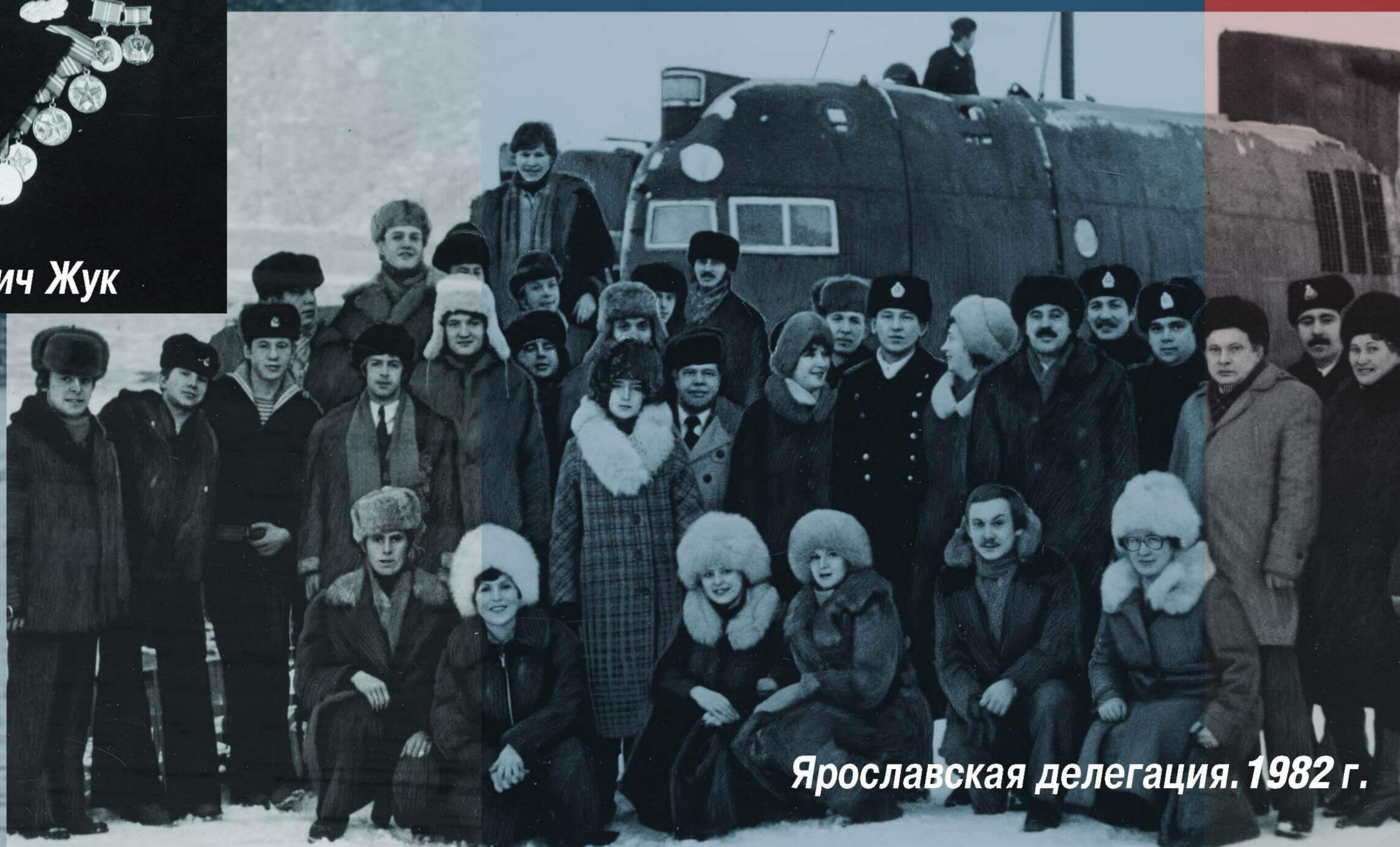
Ярославская делегация. 1982 г.