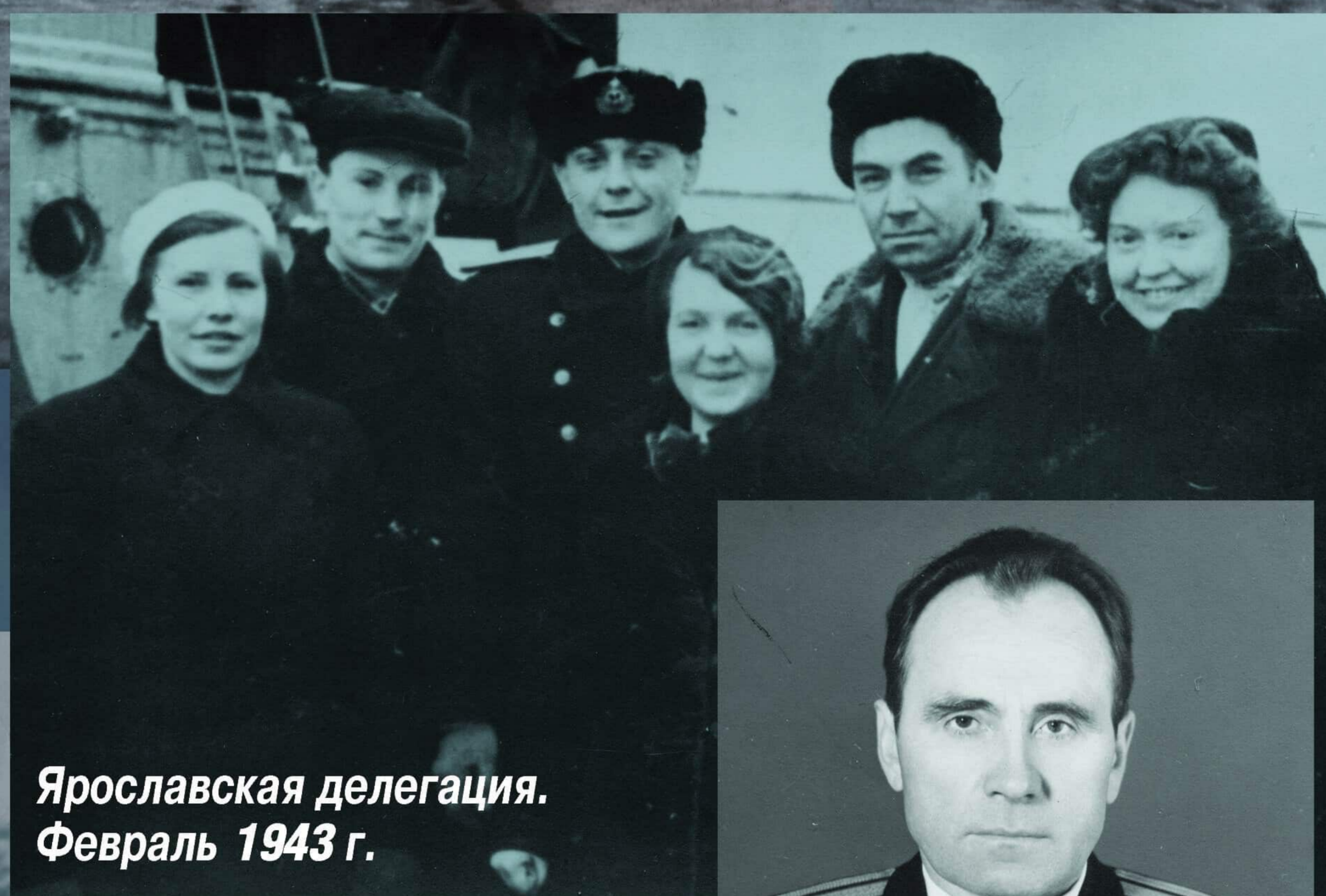
Ярославская делегация. Февраль 1943 г.

Дружба между молодежью Ярославской области и подводниками-североморцами, зародившаяся в далеком 1943 г., прошла испытание временем: и военным, и мирным.